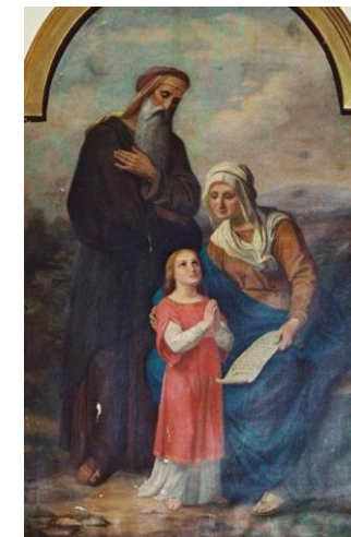
SVETI JOAKIM I ANA