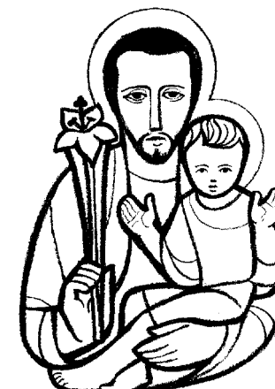
Moli za nas!